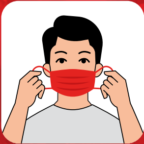
MASKENİ DOĞRU TAK