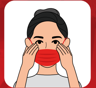
ELİNLE YÜZÜNE DOKUNMA