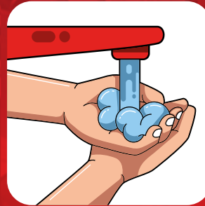
ELLERİNİ SIK SIK YIKA